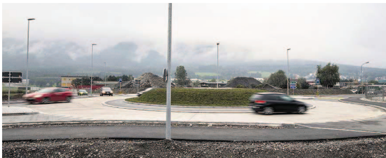
Hilcona-Kreisel: Der neue Kreisel, der den Industriezubringer Schaan mit der Bendererstrasse verbindet, ist seit kurzem befahrbar. Die Umleitung über die Strasse im Rietacker ist aufgehoben. Die Freigabe des ganzen Industriezubringers samt Anschlüssen erfolgt am 16. November.

Zuerst einmal freut es mich, dass beim Industriezubringer Schaan sowohl die Kosten wie auch die vorgegebenen Termine eingehalten werden können. Der Eröffnung am Samstag, 16. November, steht also nichts mehr im Wege. Auch wenn wir anschliessend noch einige bauliche Arbeiten fertigstellen müssen. Die Fertigstellung möchten wir zusammen mit der Bevölkerung im kleinen Rahmen feiern und ihr dabei die Möglichkeit geben, den Industriezubringer Schaan vor der Verkehrsfreigabe zu Fuss, mit dem Fahrrad oder mit einem Shuttle zu erleben. Dazu möchte ich alle Interessierten bereits heute recht herzlich einladen und ich nutze die Gelegenheit, mich bei allen am Projekt Beteiligten recht herzlich für ihren Einsatz zu bedanken.